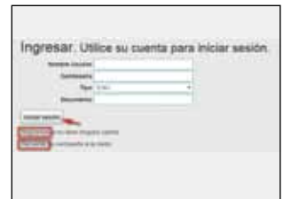
» Ingreso al Sistema