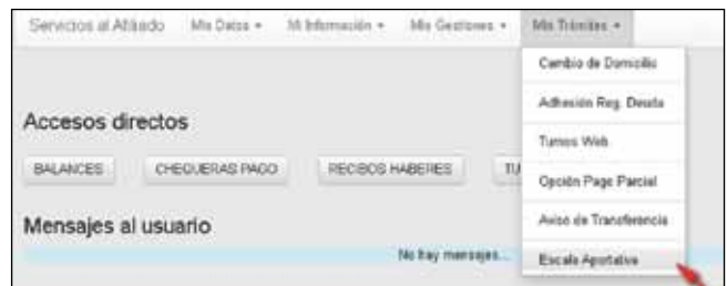
» Opción de Menú "Escala Aportativa"