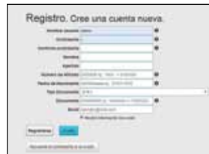
» Registración de Usuario