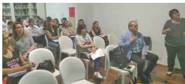
Dpto. Rosario / Colegio de Fonoaudiólogos 2da