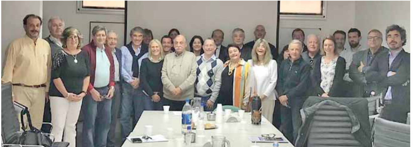
Colegios y gremiales zona Sur

El Directorio en su conjunto, trabaja arduamente buscando el consenso con los colegios profesionales e instituciones gremiales en defensa y acompañamiento de los afiliados. A continuación enumeramos gestiones realizadas por el Directorio: