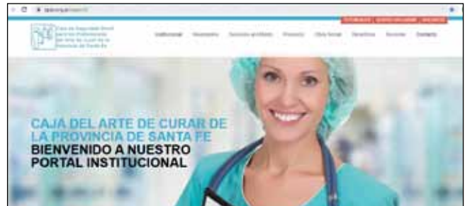
» Ingresar a www.cpac.org.ar . Seleccionar la opción AFILIADOS

Luego de ingresar los datos solicitados, debe presionar el botón "Siguiente" para proceder a la validación de la información. Finalmente recibirá un mail en su correo electrónico indicando la recepción del trámite. Si Ud. es Responsable Inscripto (con monto igual o inferior a la Categoría D de Monotributo) recibirá un mail en su correo electrónico indicando la documentación que debe presentar.