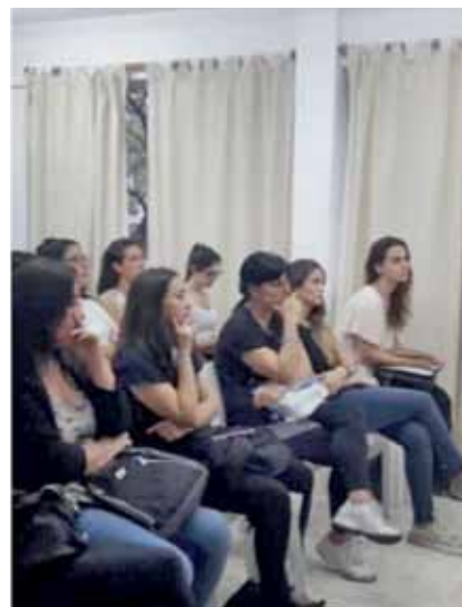
Dpto. Rosario / Colegio de Nutricionistas 2da

Los Directores y consejeros de la zona Sur, recorren los diferentes departamentos, escuchando las problemáticas de los afiliados y explicando el nuevo sistema Aportativo y la Regularización de Deudas aprobada por la legislatura. Actividades desarrolladas antes de que se declare la pandemia en marzo de 2020.