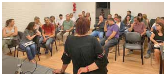
Dpto. Villa Constitución