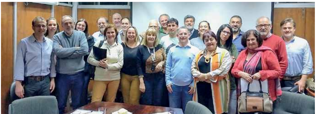
Colegios y gremiales zona Norte

8. La no pérdida de derecho previsional y obra social durante la pandemia.