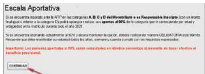
» Introducción al Trámite.