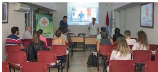
Dpto. Rosario / Colegio de Bioquímicos 2da