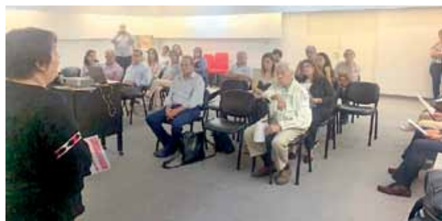
Dpto. Gral Lopez